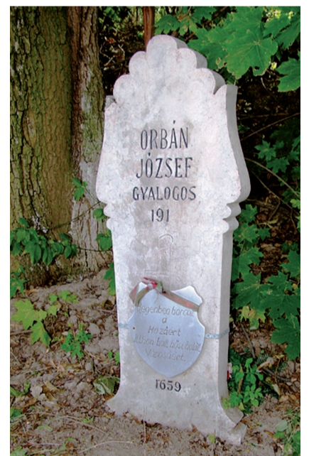
ORBÁN JÓZSEF SÍREMLÉKE

A cs. és kir. 65. gyalogezred története eléggé feldolgozott, de a háború sok arca tekint vissza reánk. Sátoral-