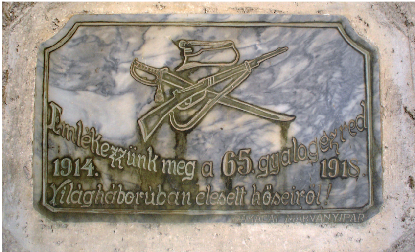
AZ EZRED EMLÉKTÁBLÁJA AZ EGYKORI HONVÉDLAKTANYÁBAN